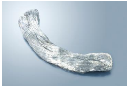
鉛毛 1 束 (5kg)

【用途】配管類のコーキング材や主に遮蔽を必要とする現場で、隙間を埋める充填材として使用される等、幅広い用途に活用されています。