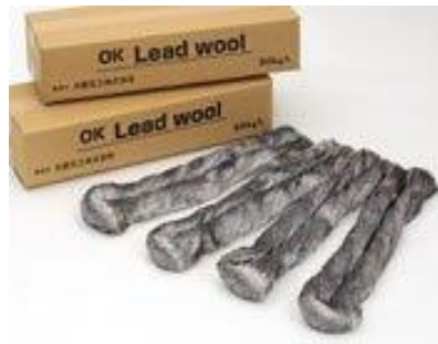
1 ケース 5kg × 4 束入